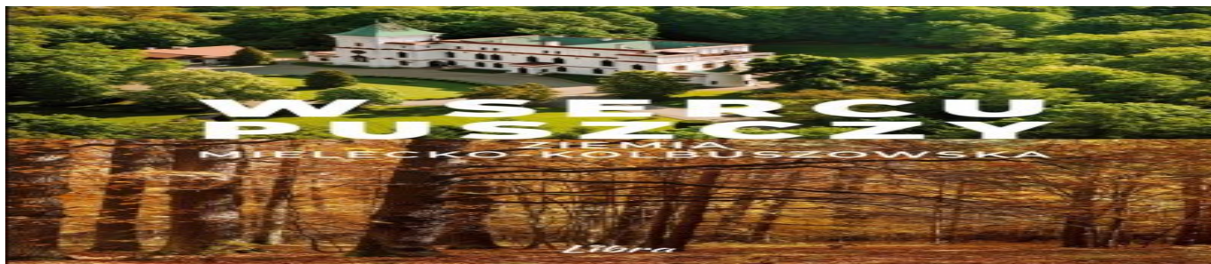
W sercu Puszczy - okładka