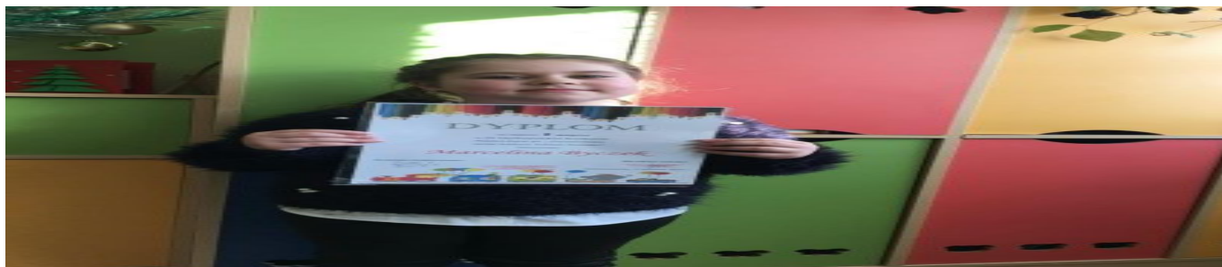
Uczennica szkoły Podstawowej w Przylęku