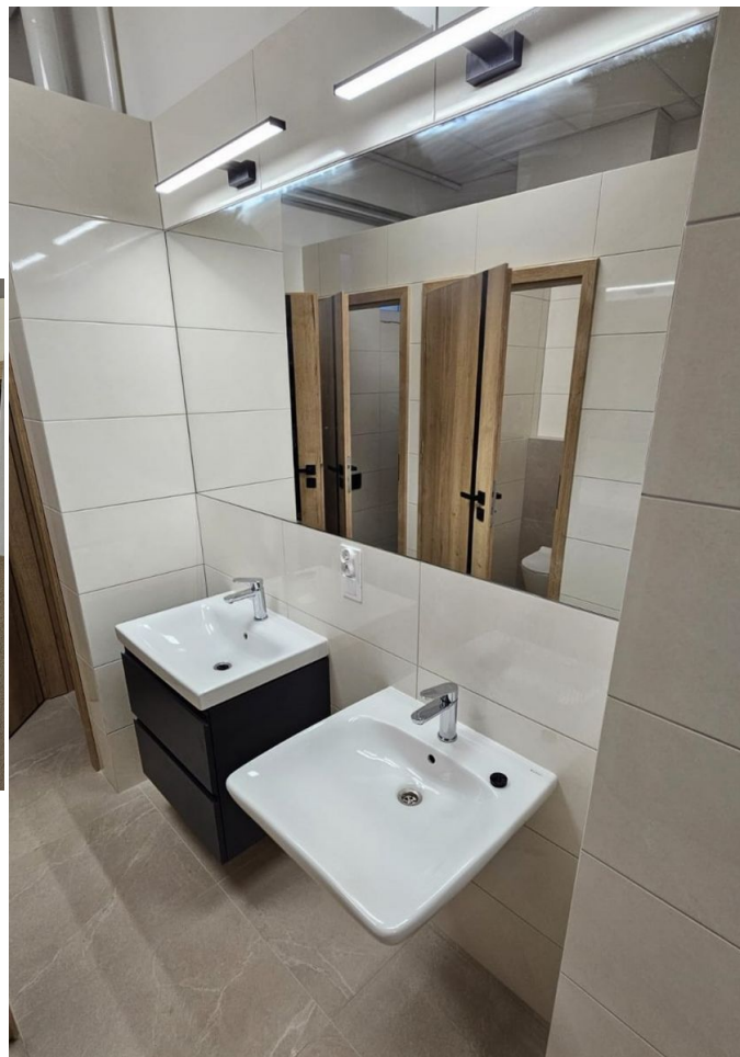
Modernizacja wewnętrzna budynku remizy OSP w Przyłęku (zaplecze kuchenne) - 137 375zł.