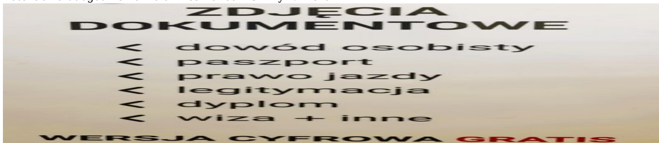
Fotokabina udogodnieniem dla Mieszkańców Gminy Niwiska

Wychodząc naprzeciw potrzebom naszych mieszkańców, w Urzędzie Gminy w Niwiskach została zainstalowana fotokabina. Wygodnie i szybko można wykonać niezbędne zdjęcie do dokumentów takich jak dowodu osobistego, paszportu, prawa jazdy, legitymacji, dyplomu czy wizy.