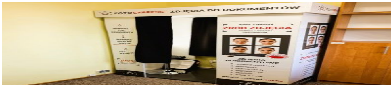
Fotokabina udogodnieniem dla Mieszkańców Gminy Niwiska