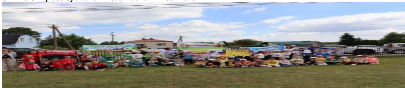
Gminna Olimpiada Sportowa Przedszkolaków Trześć 2026