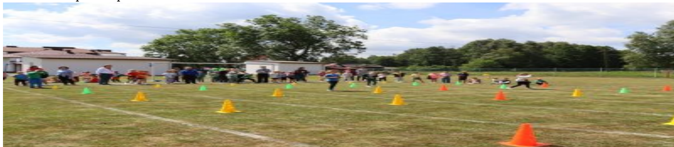
Gminna Olimpiada Sportowa Przedszkolaków Trześć 2026