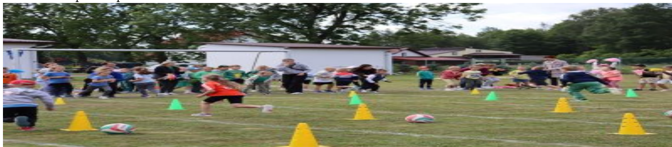
Gminna Olimpiada Sportowa Przedszkolaków Trześć 2026

Już po raz trzeci przedszkolaki z Gminy Niwiska wzięły udział w sportowej rywalizacji w ramach Olimpiady Przedszkolaka. W tym roku to święto przedszkolnego sportu miało miejsce 16 czerwca, gospodarzem zawodów była Szkoła Podstawowa w Trześci. Otwarcie olimpiady poprzedziła prezentacja drużyn następnie w wesołym korowodzie przedszkolaki przeszły do miejsca gdzie przy fladze państwowej złożyły olimpijskie ślubowanie. Po ślubowaniu pod opieką swoich pedagogów i sędziów prowadzących zawody przeszły na boisko sportowe w SP Trześć gdzie przygotowane były