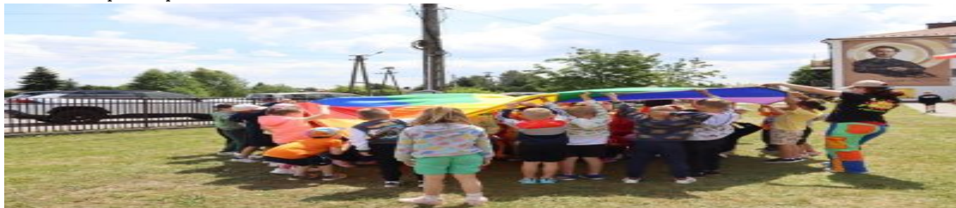
Gminna Olimpiada Sportowa Przedszkolaków Trześć 2026