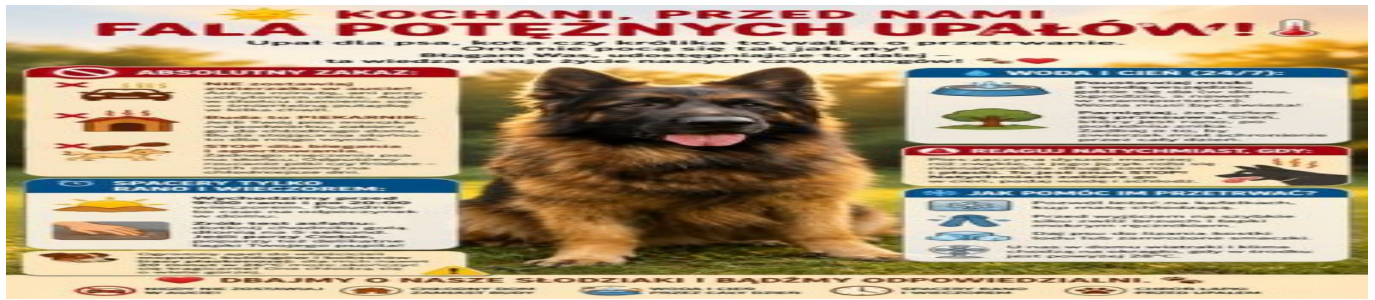
Upały - jak chronić zwierzęta przed wysokimi temperaturami