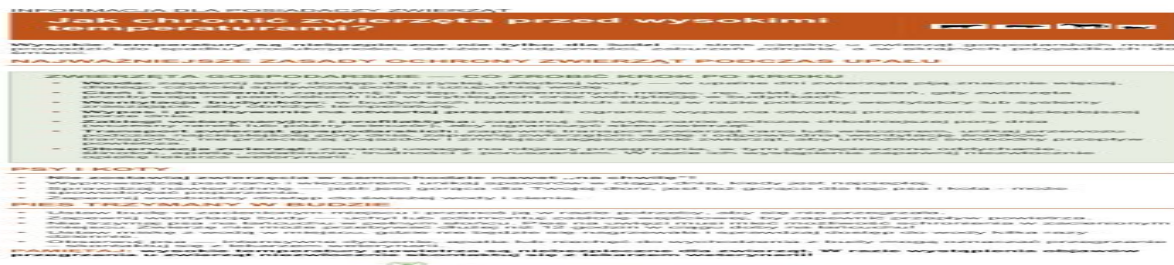
Upały - jak chronić zwierzęta przed wysokimi temperaturami

Wysokie temperatury to poważne zagrożenie nie tylko dla ludzi, lecz także dla zwierząt. Fale upałów mogą prowadzić do przegrzania organizmu, odwodnienia, pogorszenia dobrostanu, a w skrajnych przypadkach nawet do śmierci zwierzęcia. W związku z trwającymi wysokimi temperaturami, przypominamy o podstawowych zasadach opieki nad zwierzętami towarzyszącymi i gospodarskimi.