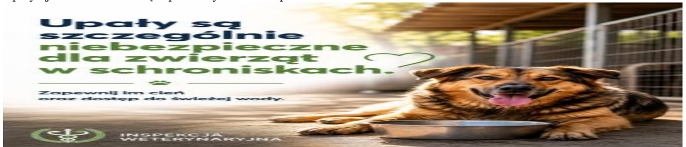
Upały - jak chronić zwierzęta przed wysokimi temperaturami