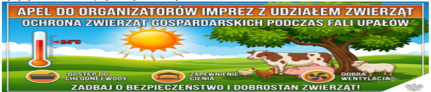
Upały - jak chronić zwierzęta przed wysokimi temperaturami