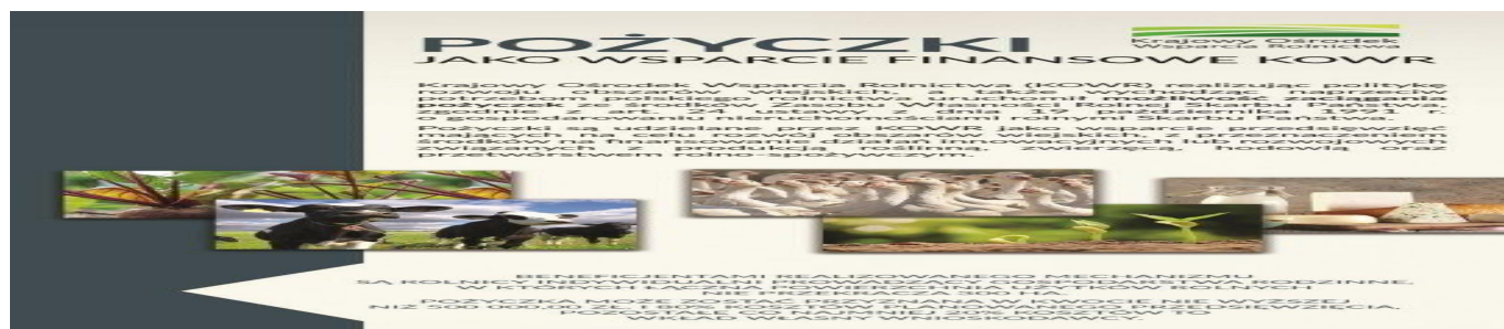
Pozyczki KOWR str. 1 ulotka