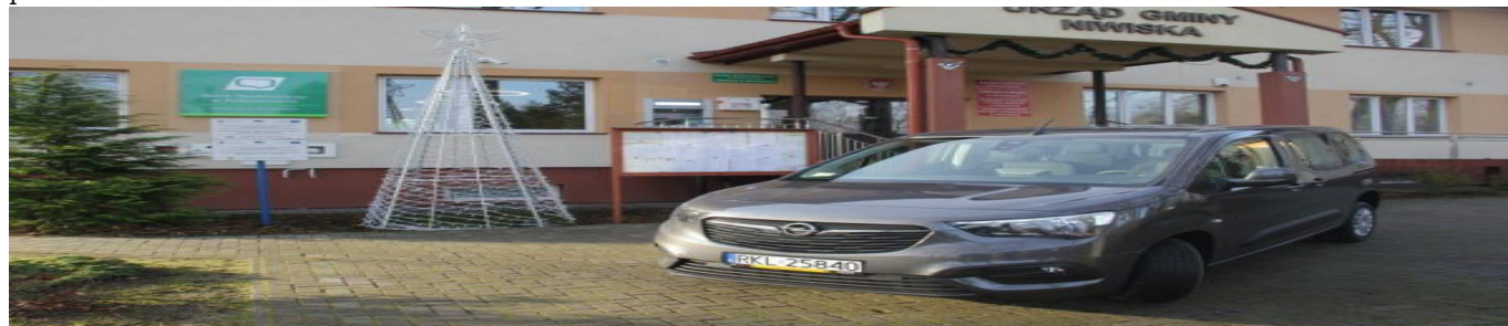
door to door - samochód