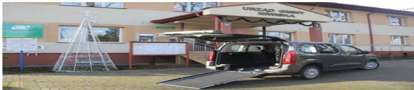
door to door - samochód