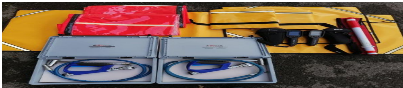
Nowy sprzęt OSP Niwiska