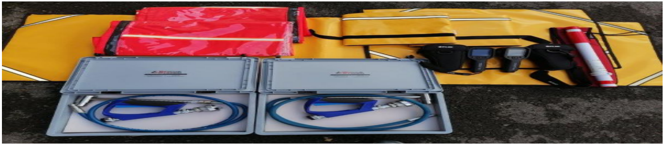
Nowy sprzęt OSP Niwiska