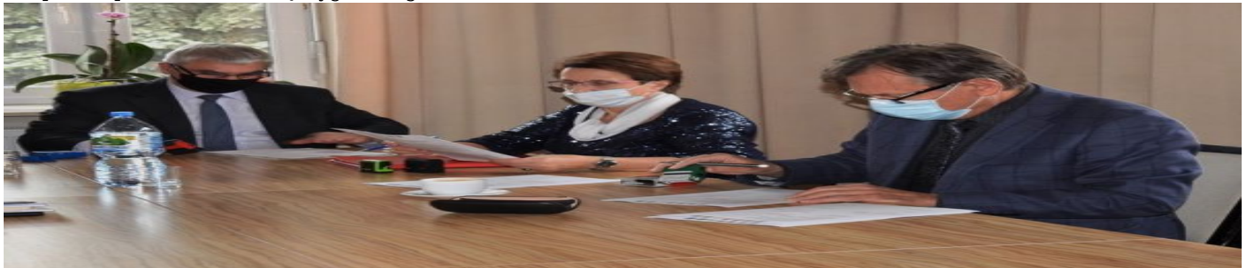
Podpisane porozumienia międzygminnego