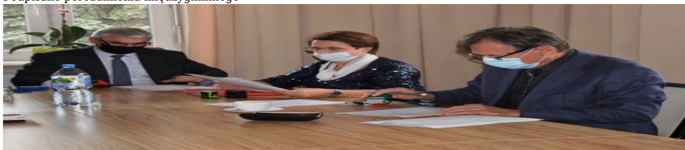
Podpisane porozumienia międzygminnego