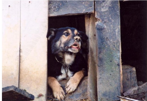
Zdiagnozowany w 2012 r. w pow. rzeszowskim przypadek wścieklizny u psa (postać szalowa)

Wyróżnia się 2 postaci choroby: agresywną (szałową) i cichą (porażenną).